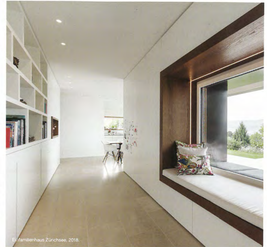
Einfamilienhaus Zürichsee, 2018.