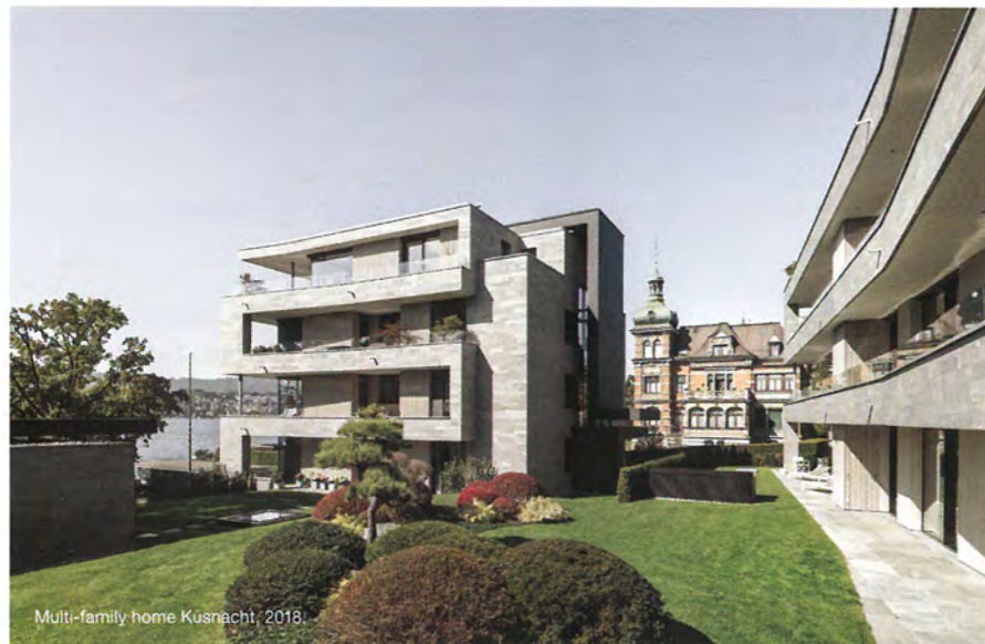
Multi-family home Küsnacht, 2018.