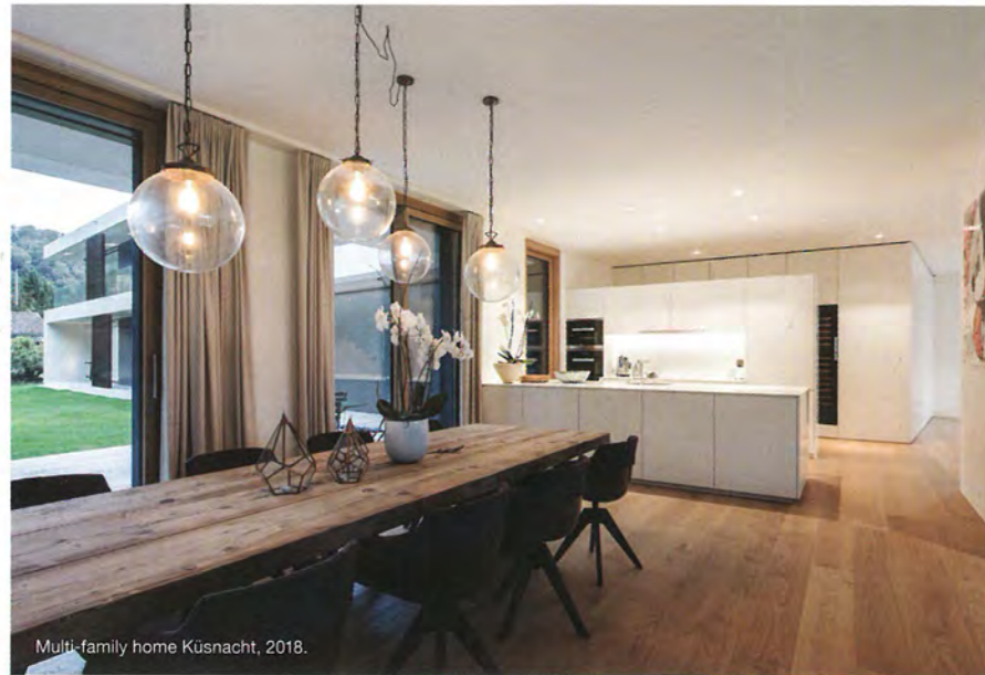
Multi-family home Küsnacht, 2018.