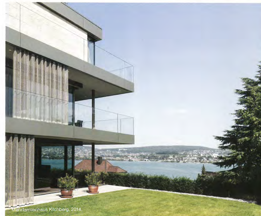
Mehrfamilienhaus Kilchberg, 2014.