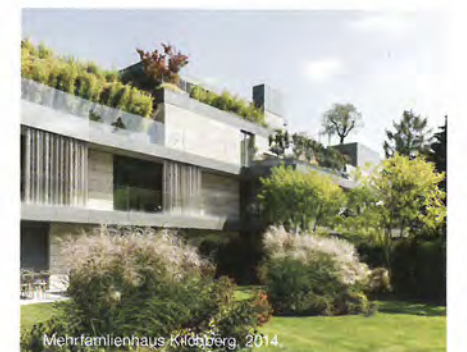
Mehrfamilienhaus Kilchberg, 2014.