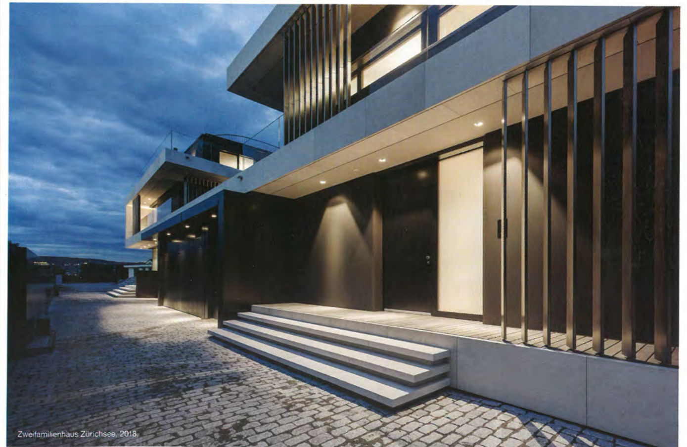
Zweifamilienhaus Zürichsee, 2018.