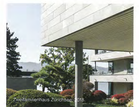
Zweifamilienhaus Zürichsee, 2018.