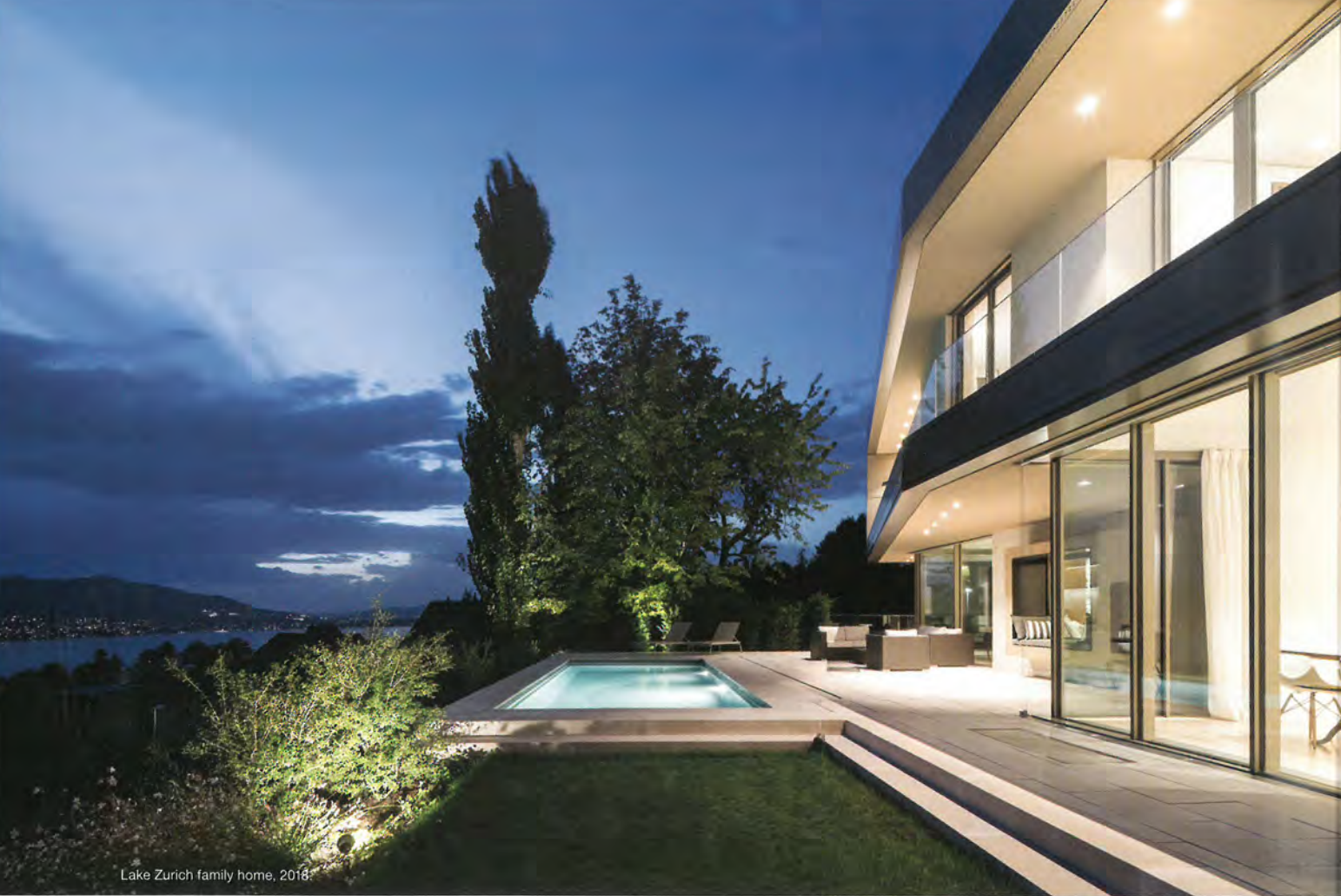
Lake Zurich family home, 2018.

ARNDT GEIGER HERRMANN-Kunden vereint das Interesse an Mensch und Architektur im Zusammenspiel. Der institutionelle Kunde mit Augenmerk auf Professionalität, Zeitraum und Ökonomie ist hier ebenso willkommen wie die Erbgemeinschaft, die eine Reihe neuer Mehrfamilienhäuser auf ihrem Grundstück baut. Dann gibt es Paare, die sich den gemeinsamen Traum des eigenen Hauses erfüllen oder den Manager, der aus Zeitgründen für seine Villa am See gern sowohl Außen- als auch Innenausstattung dem AGH-Team überlässt. Die Architekten kümmern sich jedoch auch um großangelegte Projekte, so wie das Ausbildungs-Zentrum für eine Großbank, komplett mit Hotelanlage. Wie